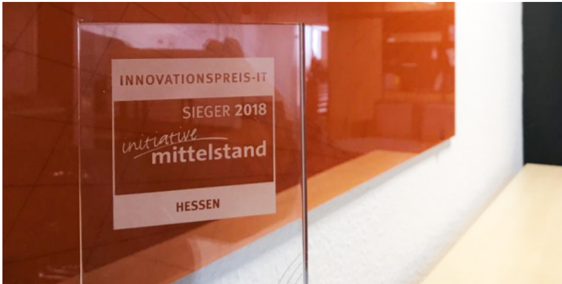
Der INNOVATIONSPREIS-IT 2018 in der KeyIdentity-Zentrale - Zum Vergrößern bitte klicken -